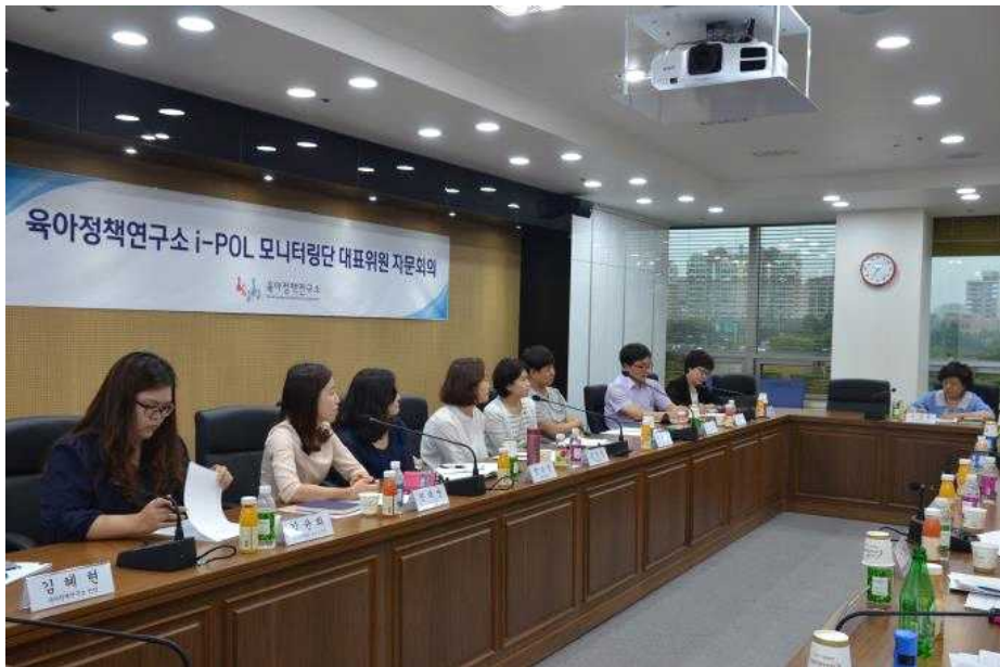
[그림 II-2-1] i-POL 모니터링단 대표위원 자문회의 진행 사진

연구진은 이상의 의견에 근거하여 i-POL 우수제안 제도, daily 육아정책동향 탑재 등에 대한 2015 i-POL 모니터링단 활성화 방안을 수립·시행하였다.