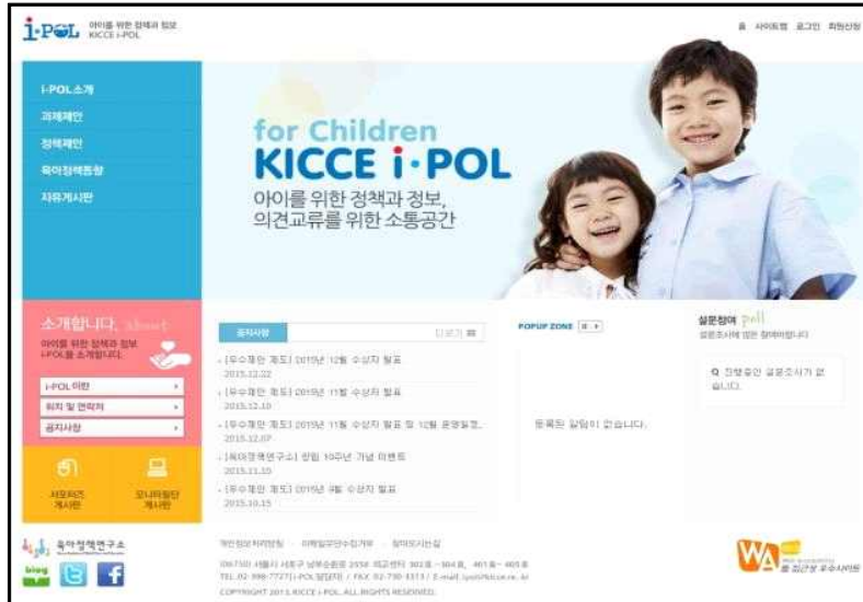
[그림 II-6-1] i-POL 홈페이지 메인 화면