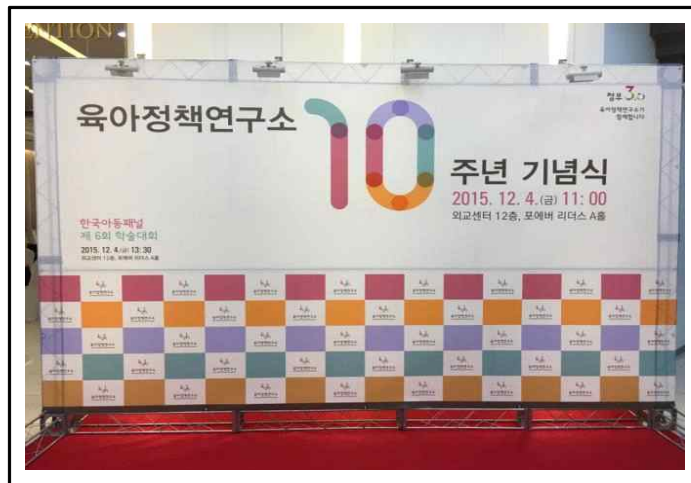
[그림 11-7-2] 육아정책연구소 창립 10주년 기념식 포토존 설치 모습