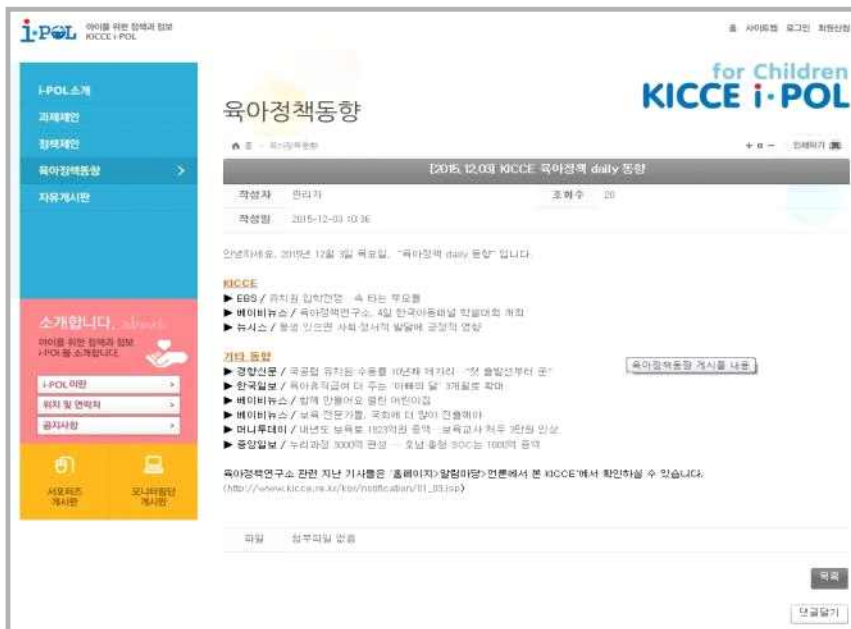
[그림 II-3-2] i-POL 홈페이지 내 육아정책동향 게시판 화면 2