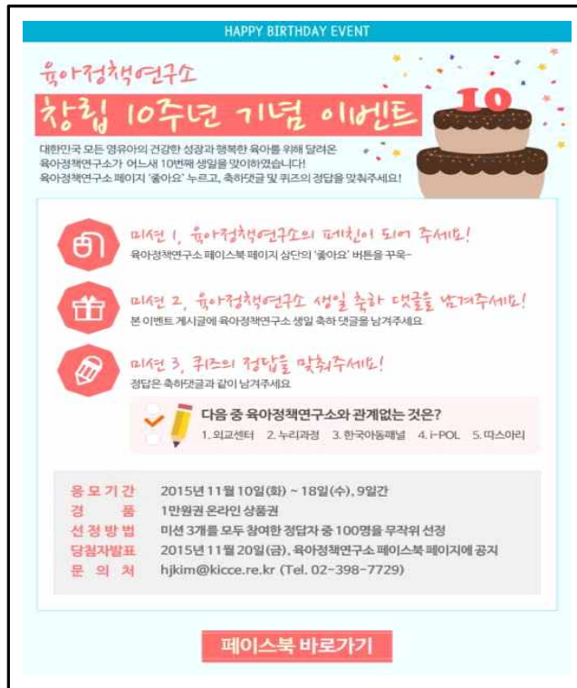
[그림 11-7-1] Facebook 이벤트 공지