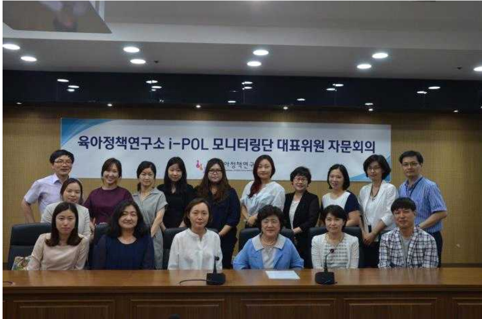
[그림 II-2-2] i-POL 모니터링단 대표위원 자문회의 기념 사진