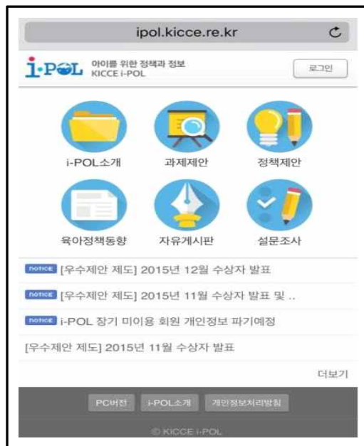
[그림 II-6-2] i-POL 모바일 홈페이지 메인 화면