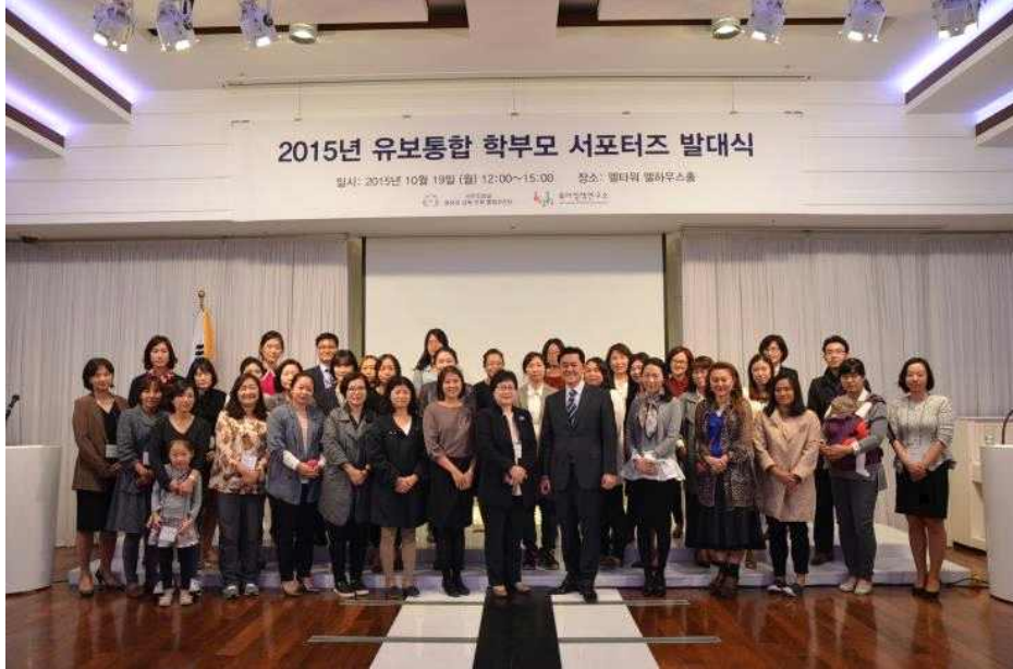
[그림 II-5-2] i-POL 학부모 서포터즈 발대식 기념 사진

2015년 i-POL 서포터즈 활동 내용은 다음과 같다. 우선 유보통합 설명회에 참여하여 유보통합에 대하여 설명을 듣고, 유보통합 등 육아 관련 정보를 청취하고 정보를 확산·전달하는 서포터즈의 역할을 위촉받는다. 향후에도 유보통합에 대한 다양한 정보를 전달받아 개인 SNS와 활동하는 카페에 게시하는 등 다양한 정보를 확산하고, 일반인들에게 유보통합에 대한 의견을 수렴하고 연구소와 국무조정실 영유아교육·보육통합추진단에 전달하는 미션을 부여받는다.