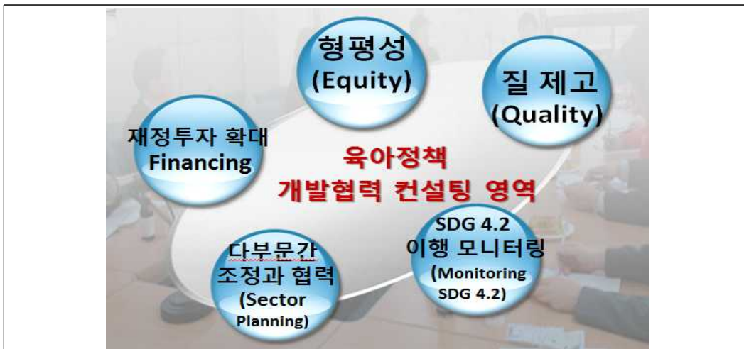
[그림 II-2-3] 아태지역 국가의 SDG4.2 달성을 위한 5가지 정책영역