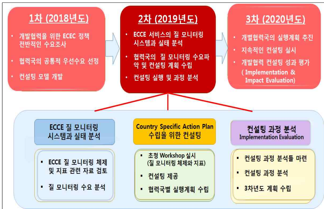
[그림 I-1-1] 육아정책 개발협력 3개년 연차별 계획 및 2차년도 연구개요

본 연구의 연차별 주제와 2차년도(2019년) 연구의 개요를 제시하면 다음 그림과 같다.