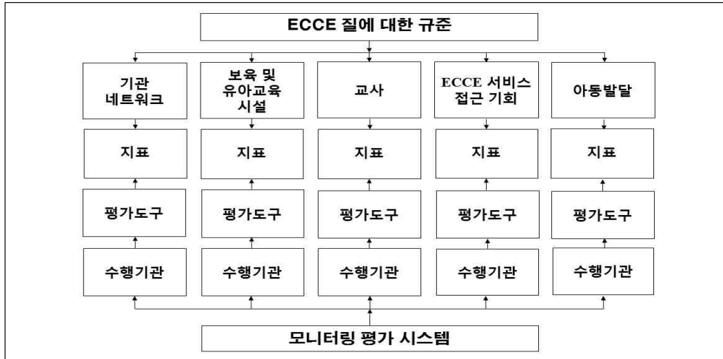
[그림 III-2-1] 베트남 ECCE 서비스 모니터링 평가시스템