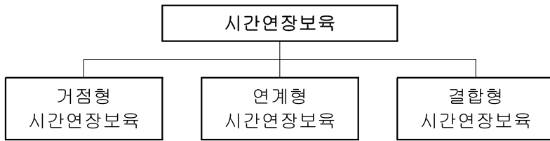
[그림 3] 시간연장보육 운영 모델