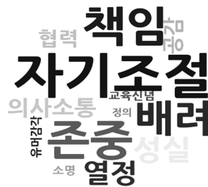
[그림 1] 인성 덕목 추출 결과

영유아교사 인성에 관한 선행연구(구미향, 2017; 김경령·서은희, 2014; 김순환·박선혜·남선옥, 2014; 김은설, 2016; 김은설·김길숙·이민영, 2015; 박은혜, 2017; 서경혜·최진영·노선숙 외, 2013; 이영림, 2016; 전재선, 2011; 조운주, 2014; 홍순정, 2017)에서 제시한 덕목과 원장, 교사, 부모 설문에서 추출된 덕목을 빈도에 따라 상위 13개를 선택한 결과 자기조절(인내), 존중, 책임, 성실, 배려, 열정, 의사소통, 공감(이해심), 협력, 교육신념, 소명, 유머감각, 정의로 나타났다. 그 결과를 워드클라우드(wordcloud) 프로그램을 활용하여 시각화하면 [그림 1]과 같이 표현될 수 있다.