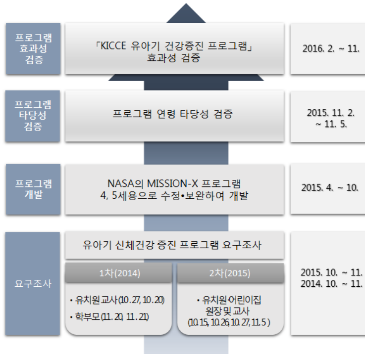
[그림 1] 「KICCE 유아기 건강증진 프로그램」 연구 수행 과정