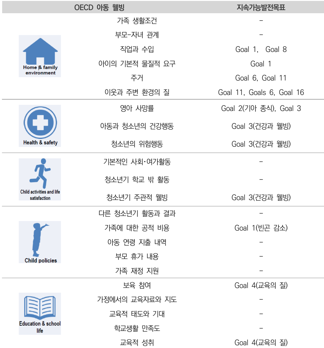
〈표 5〉 OECD 아동웰빙과 지속가능발전목표

자료: Marguerit, D., Cohen, G., & Exton, C. (2018). 아동 웰빙과 지속가능발전 목표: OECD국가들의 아동과 청소년은 얼마나 목표와 거리가 있는가? (Child well-being and the sustainable development Goals: How far are OECD countries from reaching the targets for children and young people?)