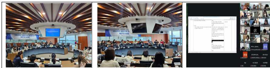
[그림 I-3-1] 1~3차 17개 시도교육청 협의회